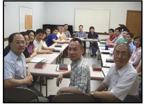
合一的團隊全心為神國努力