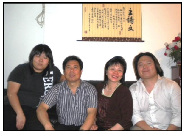
國輝同學全家團聚其樂融融

挽回，這污穢不堪的浪子，才真正重生得救。神的恩召臨到，迫使我對傳福音、拯救失喪靈魂產生負擔。特別是來越多的福州移民，他們離鄉背井，重擔壓肩，心靈虛空，生命