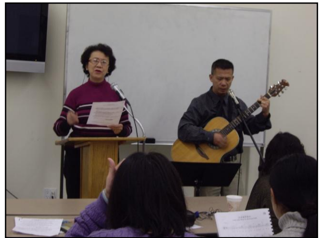
席專同學(右)與夫婿探索人類文化遺跡

感謝老師、同學、弟兄姐妹們一路扶持，因著他們的代禱、關懷、金錢上的奉獻，我今日才能畢業，才能繼續往前走。願一切頌讚、榮耀、感謝...都歸於我們在天上的阿爸父神！