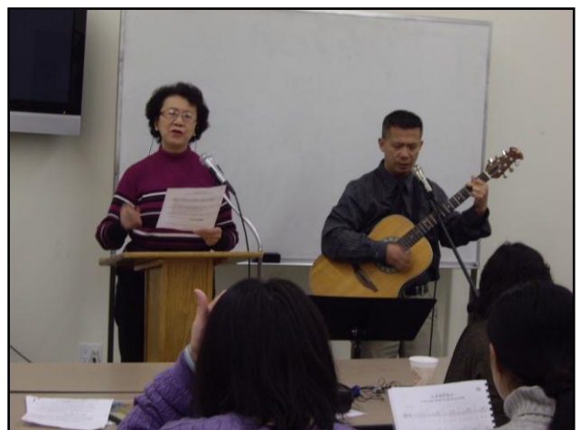
神在惠榮同學的生命中塗上色彩

神學院的訓練，是無價之寶； 每天最大的快樂，就是背著書包往學校的道路走。 匆匆光陰似箭，我如今已要畢業！ 牧師和老師們的教課，我是如此陶醉， 神透過祂僕人們所釋放的訊息， 讓我沈浸其中， 我彷彿已把這些話吞進肚腹， 主說：「撇下一切，來跟隨我吧！」 祂如此地吸引著我， 我願意跟隨祂， 一生一世榮耀祂的名， 也願意一生被祂使用， 跟隨祂到永生！