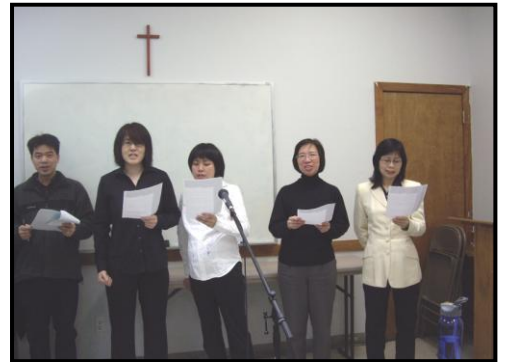
我們定要唱出耶和華的大慈愛