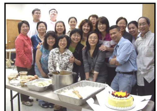
畢業了，怎能忘記共處的喜樂？