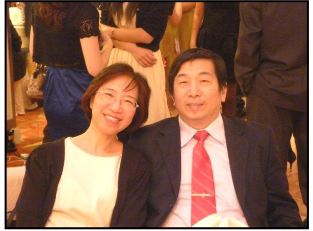
曉文同學另一半全心支持她的服事與學習

按人的理解，神實在是很孤單。神何必呢？何必愛人？神卻教導人用祂的樣式去愛，把尊貴輝煌放一邊，忍受被頂撞、被拒絕、被撕裂...還要再想辦法讓人能接受祂的愛...，學院老師告訴我們，神用威嚴的樣式一人害怕而拒絕祂；用