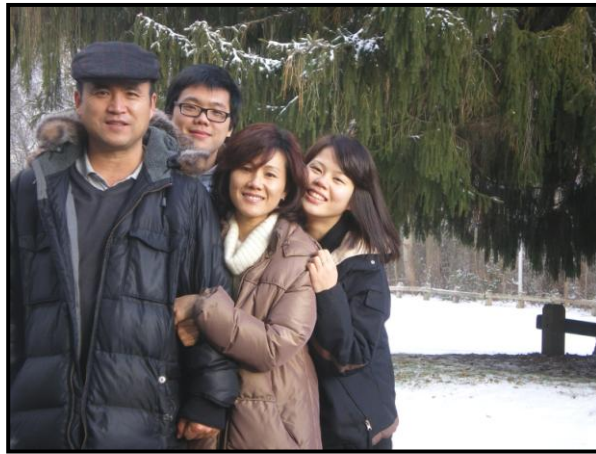
金牧師與「緊密」的家人

以色列人在埃及拜慣了偶像，在埃及神不能跟他們同住。從埃及出來，神很想和他們同住，以色列人可能會想：「神要跟我們一起住，怎麼住啊？」他們看過法老的金字塔，法老死了「住」在金字塔裡等復活、得永生。「住」的概念很重要。神如何與以色列人同住？以色列人在西乃曠野看見的是雲彩，就是神的榮耀，就是神的「shekinah」；神的