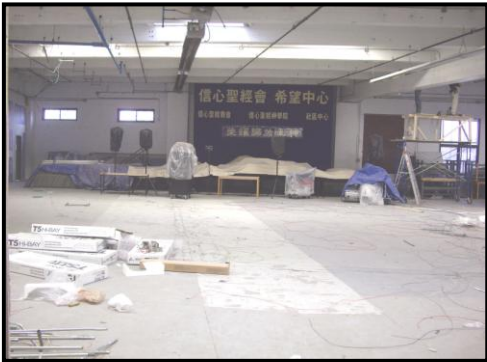
因為他的帳幕要擴張