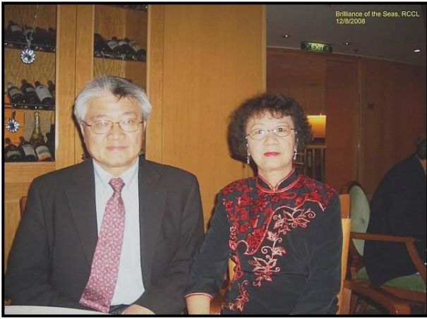
重芬同學(右)與神所配生命的另一半