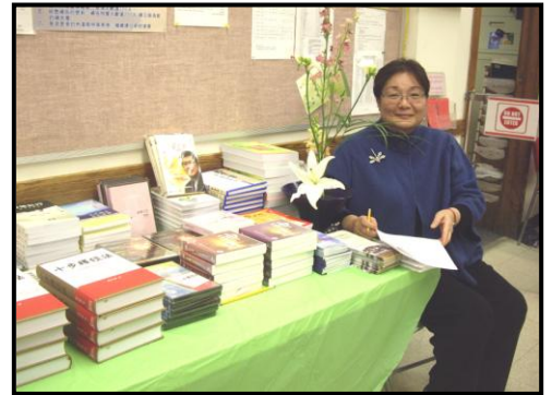
密集課常帶出讀書熱潮