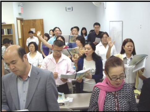
學生早禱會的敬拜