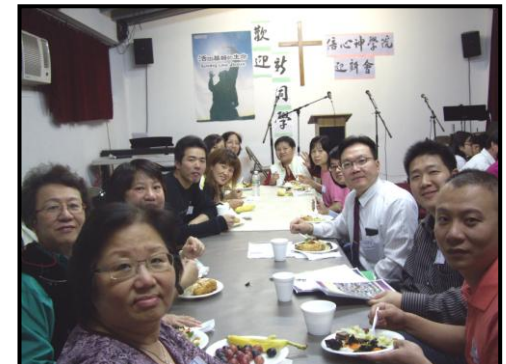
迎新會新舊同學歡聚一堂