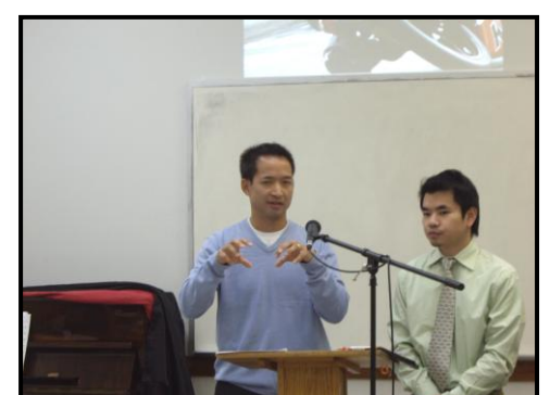
即席翻譯中英文為全方位訓練項目之一