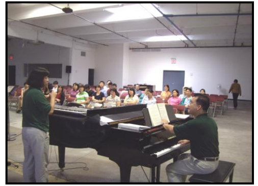
建立教會音樂敬拜事工課程(一)