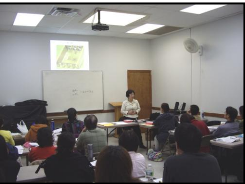
摩西五經課中觀賞會幕模型