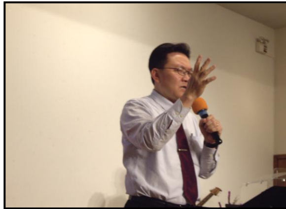
群羊時刻都在郝牧師心上

甚麼是「試煉」？雅一 12-18 說「試煉」是出於神，神卻不「試探」人。那麼要如何解釋「試煉」呢？不少基督徒對於「成長」有一種錯誤的觀念。一聽到為主殉道的見證，就覺得殉道的人特別偉大，羨慕他們的經歷，盼望自己將來也能有這樣的經歷。願意為主受盡苦頭，這樣才顯得出榮耀。像約伯一樣家破人亡，或經歷嚴重的意外，或被監禁，或失去自由，這才叫「試煉」。才能叫人有真正的信心。這是錯誤的解