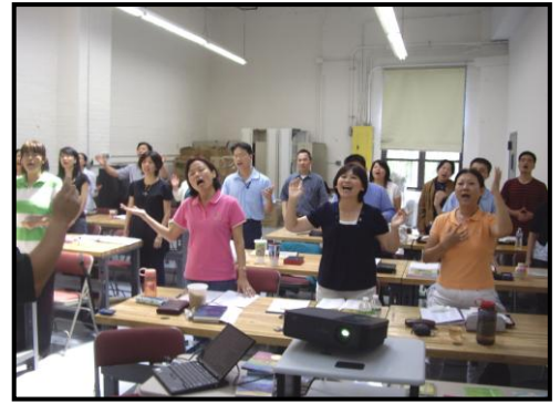
快樂的學習，學習的快樂(二)