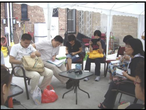
領袖高峰會休息時的討論