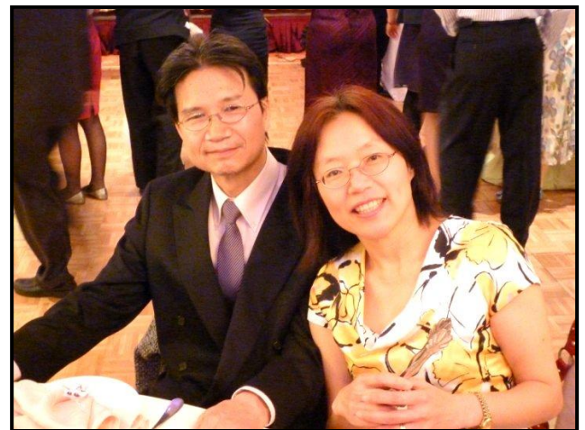
以文與先生沐浴在神的愛中多美好

紐約的生活指數比德州高出許多，我們的預算只能租到法拉盛市區的地下室。信心教會中有對愛主的夫妻，將一套離神學院又近，交通又方便的公寓房，以地下室價格租給我