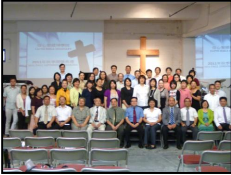
2011年秋季開學典禮師生合照