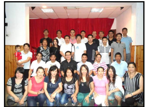
義大利神學訓練中心的同學們