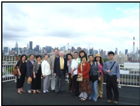
師生一同為全紐約市屬靈爭戰祈禱