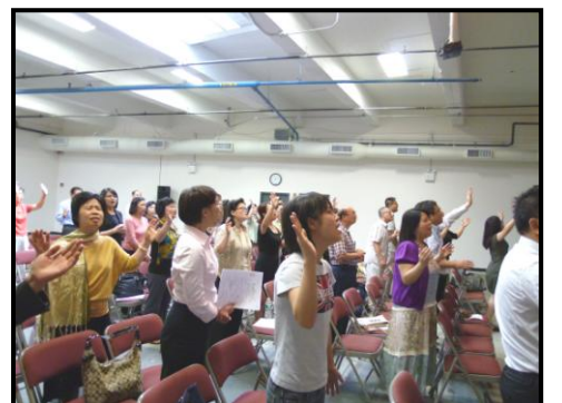
有甚麼比心中的喜樂更讓神喜樂？