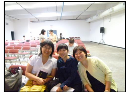
師生快樂之情溢於言表