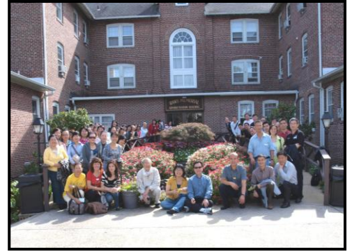
2011年教牧同工與神學院靈修日

5. 為方便在神話語的裝備上造就東亞和東南亞的基督工人，神學院已在香港設立神學訓練中心，將在十二月為二學分之「羅馬書」及「釋經此一事工，為更多願委身的工人開路，能前去接受裝備。也請您為此一新事工及需要代禱，讓神大大使用這一神學訓練中心。