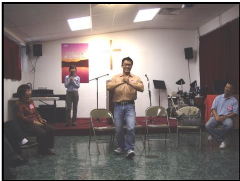
迎新會比手畫腳大猜謎