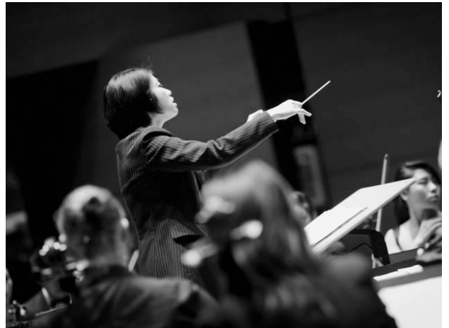
指揮著樂團心中充滿了讚美

最後我再說，教導的工作非常重要；我們一同聚集、擘餅、和弟兄姊妹相交也很重要，可以建立我們之間的關係；但同時「禱告」也是不可少的關鍵。賽五六、太廿一、可十一、路十九都曾提到「我的殿要稱為萬國禱告的殿」。這裡是教導的地方嗎？是！這裡是敬拜的地方嗎？是！但這裡「必須」是一個「禱告的地方」，因為對神來說，這是最重要的事。請你們都站起來，請你們把手牽起來，求神給我們一個渴慕禱告的心，為我們的教會，為教會的事工，為我們能成就神想要在我們身上成就的，我們一起同心禱告。