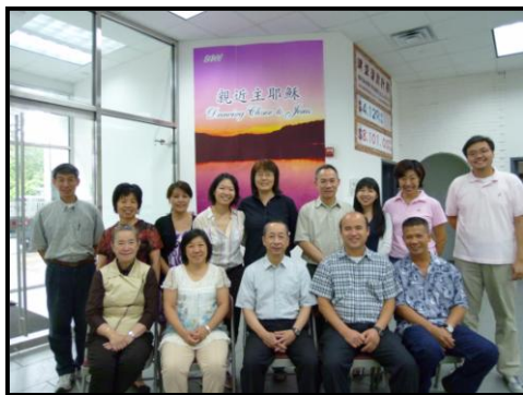
學習神事奉神以神為樂

1. 信心聖經會十六週年將於 11 月 5 日星期六下午四時在「希望中心」舉行，歡迎您撥冗參加，同慶主恩。本會 2012 年之年度主題為「揚起得勝的旌旗」。